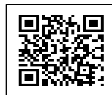
学校ホームページ