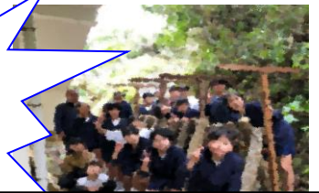
南海日日新聞に掲載されました。