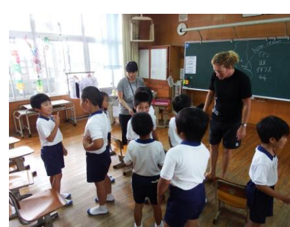
【1・2年生の授業の様子】