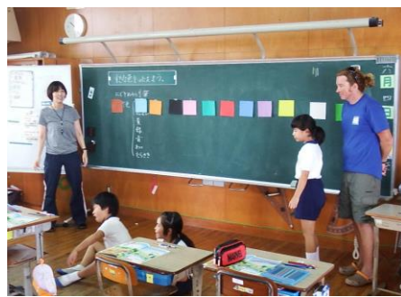
【3・4年生の授業の様子】