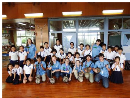
【ナカドウチェス市の皆さんと】