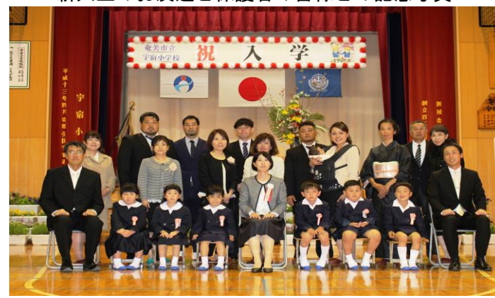
新入生のお友達と保護者の皆様との記念写真

新入生の子供たちについては、一日も早く学校生活に慣れ、充実した学校生活が過ごせるように全職員で支援していきたいと思ひます。