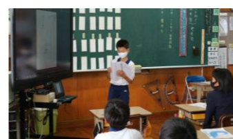
3年 故事成語(発表会)