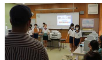
5・6年 豊かな環境のために(中間発表会) 4年 慣用句(発表会)