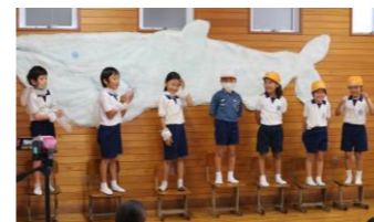
1年 くじらぐも(音読発表)

来年度は、学校全体で、そして地域の方々にもご来校いただき、学習発表会が開催できることを願っています。