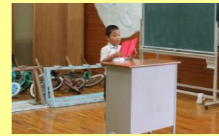
児童代表あいさつ

2学期は、秋季運動会や公開研究会がありますが、例年に比べると新型コロナウイルスの影響で行事も少なくなっています。このような状況だからこそ、一つ一つの行事を大切に、更に大きく成長できるようにしていきたいと思えます。