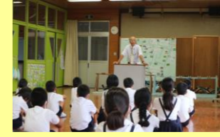
真剣に話をきく子ども