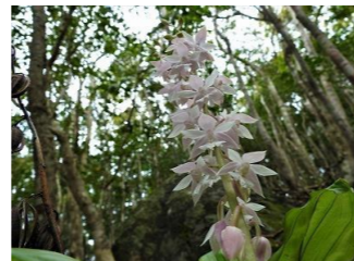
アマミエビネ (絶滅危惧ⅠA)