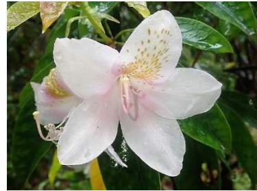
アマミセイシカ (絶滅危惧ⅠA)