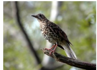
オオトラツグミ (国指定天然記念物)

世界に誇れる「宝の島」ともいわれる奄美大島の豊かな自然を、いつまでも残していけるよう子どもも大人も努めていきましょう！