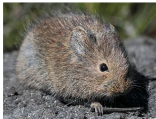
アマミトゲネズミ (国指定天然記念物)