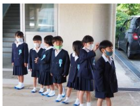
【入学式前…緊張するなあ】

新入生の子供たちについては、一日も早く学校生活に慣れて、充実した学校生活が過ごせるように全職員で支援していきたいと思ひます。本年度もよろしくお願ひします。