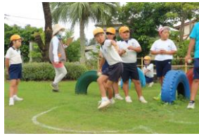
【ソフトボール投げ】