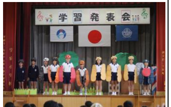
【3・4年生：「森のコホさん美容室」】