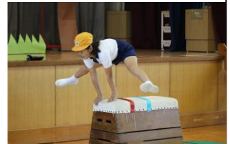
【1・2年生：「かがやけ！なないろ7人組」】