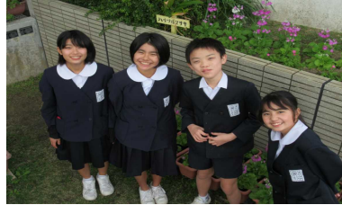
もうすぐ卒業です