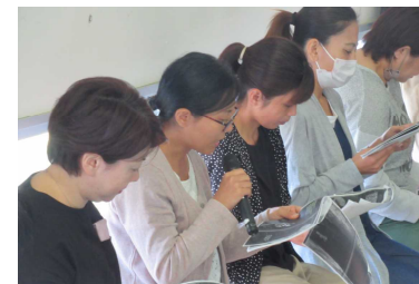
親子読書会「おもいのたけ」