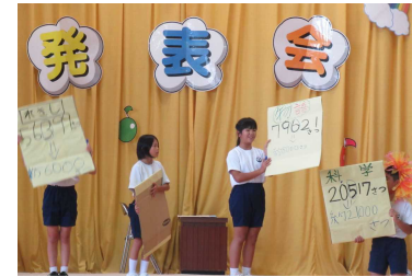
3・4年「としょかんライオン」